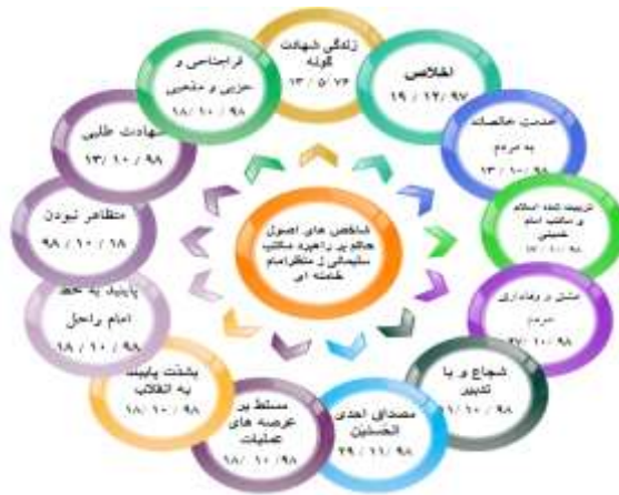
جدول ۳: بخشی از شاخص های اصول راهبردی برآمده از وصیت نامه سپهبد شهید