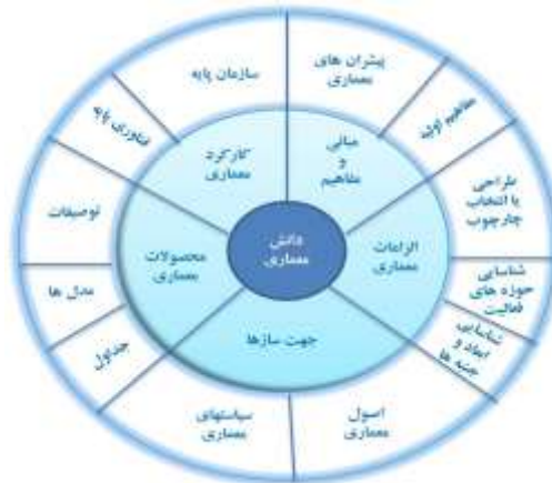
شکل ۲: ابعاد و مؤلفه‌های حوزه‌ی دانش معماری مؤثر بر الگوی راهبردی معماری نیروهای مسلح

نمای تجمیعی ابعاد و مؤلفه‌های دانش معماری در شکل زیر ارائه شده است: