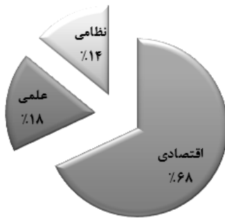
نمودار ۳- نحوه توزیع تحریم های ضد ایران بر اساس هدف

مهم ترین تحریم هایی که امریکا علیه ایران اعمال کرده است، مربوط به بخش نفت و بانکی ایران می شود که بخشی از تحریم های مربوط به این دو حوزه ذیل تحریم های CISADA ۱ تعریف می شوند. کنگره امریکا در ادامه تصویب قطعنامه ۱۹۲۹ شورای امنیت سازمان ملل، «قانون جامع تحریم ها، مسئولیت پذیری و محرومیت ایران» (سیسادا) را تصویب کرد که با امضای اوباما در اول جولای ۲۰۱۰ اجرایی شد. بر اساس این قانون شرکت هایی که بیش از ۲۰ میلیون دلار در بخش نفت و گاز ایران سرمایه گذاری کنند یا سالانه بیش از پنج میلیون دلار در سال بنزین به ایران بفروشند، قادر به انعقاد قرارداد با دولت امریکا نخواهند بود (CISADA, 2010:5).