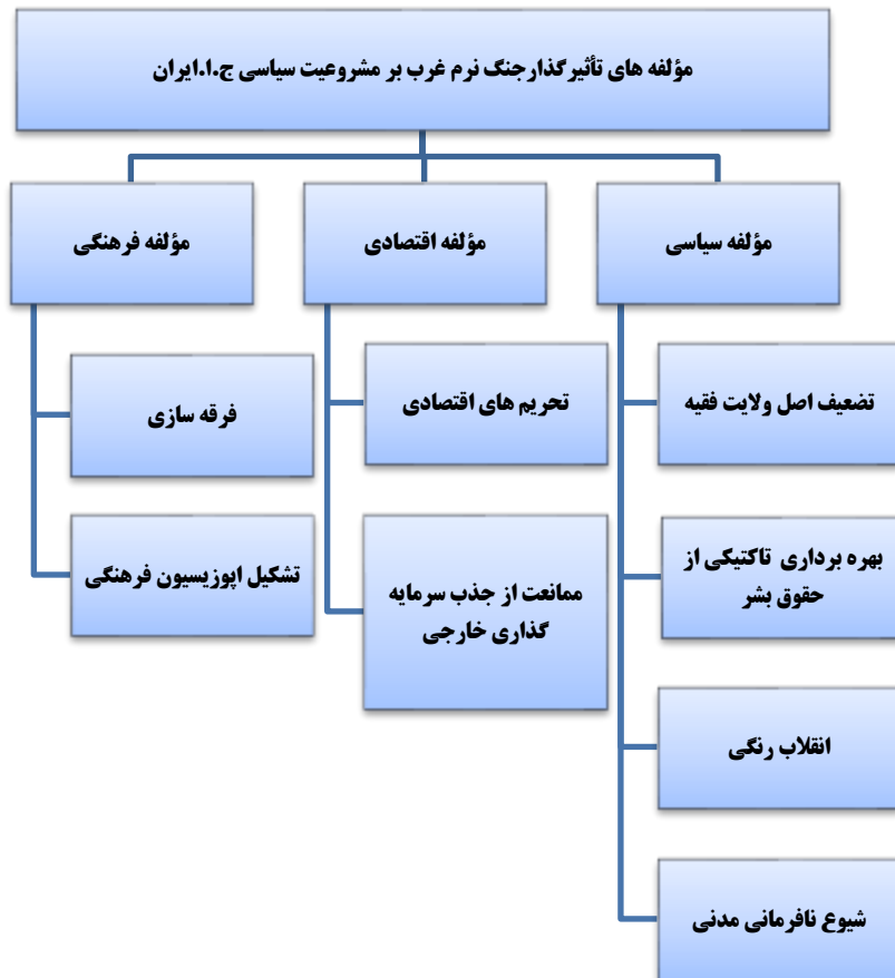
شکل ۱: مدل مفهومی تحقیق

مدل مفهومی تحقیق: مدل مفهومی تحقیق بر اساس ادبیات تحقیق به شرح شکل (۱) زیر است