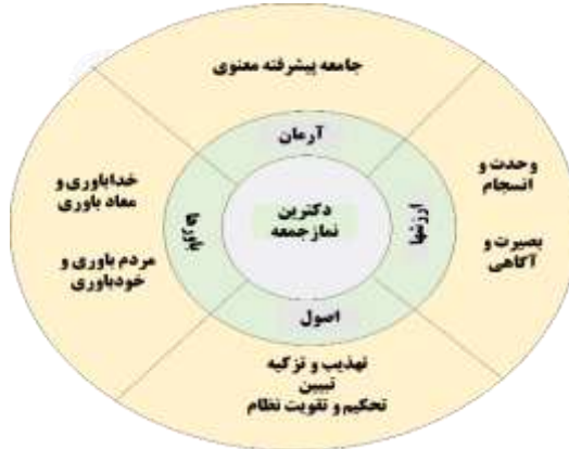
شکل ۲: مؤلفه‌ها و شاخص‌های دکترین نماز جمعه

از دیگر نتایج این تحقیق تبیین اصول، آرمان، ارزش‌ها و باورهای دکترین نماز جمعه است. اصول: «تهذیب و تزکیه»، «تبیین»، «تحکیم و تقویت نظام»، آرمان: «حرکت به سمت جامعه پیشرفته معنوی»، ارزش‌ها: «وحدت و انسجام‌بخشی»، «بصیرت و آگاهی» و باورها: «خداباوری»، «مردم باوری» مؤلفه‌ها و شاخص‌های دکترین نماز جمعه است.