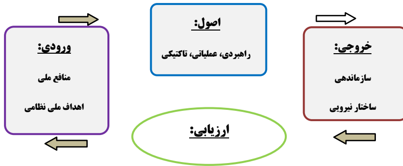
شکل ۱: فرآیند تدوین اصول نظامی نیروی زمینی آمریکا،