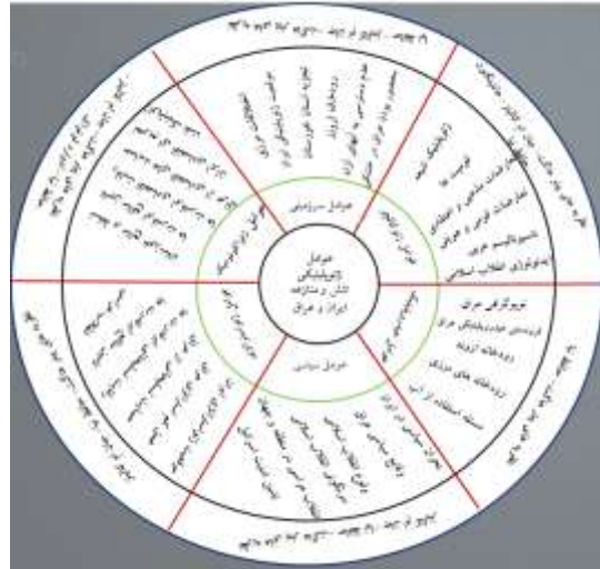
شکل ۱: نظریه‌ها