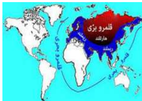
شکل ۳: ایران در نظر نیکلاس اسپایکمن

ایران در نظریه اسپایکمن، بخش مهمی از ریملند است و به همین دلیل، موضوع رقابت دو قدرت بری (زمینی) و بحری قرار گرفته است.