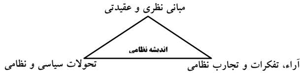
شکل ۱: مدل مفهومی

براساس این مدل، «مبانی نظری و عقیدتی» یکی از رئوس مثلث اندیشه نظامی است و در این مقاله فقط به مبانی اعتقادی به عنوان زیر مجموعه مبانی نظری و عقیدتی پرداخته‌ایم.