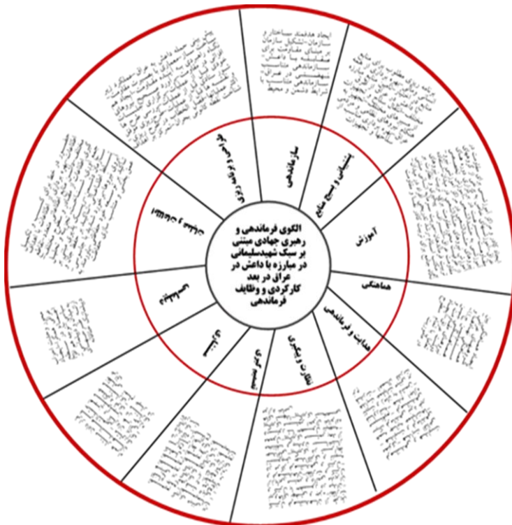
شکل ۳: الگوی نهایی تحقیق