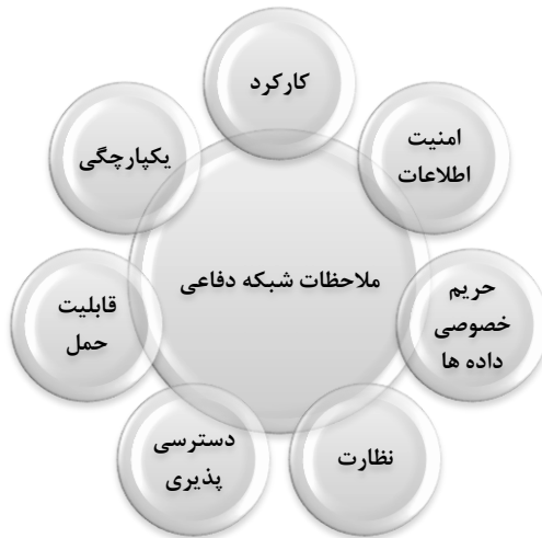
شکل ۲: ویژگی‌های مهم شبکه‌های دفاعی

همچنین مجازی‌سازی به‌عنوان اصلی‌ترین محور در ایجاد و استقرار شبکه دفاعی مطرح می‌گردد. اگرچه مجازی‌سازی توانسته قابلیت استفاده از منابع سامانه‌ها را از طریق ارائه یک سامانه به چندین کاربر افزایش دهد، اما باعث بروز مشکلات جدیدی نیز گردیده است. در این خصوص ایجاد یک شبکه دفاعی امن و یکپارچه دارای ملاحظات و وجود دارد که مستلزم به‌کارگیری متخصصان این حوزه است و برای ایجاد چنین شبکه‌ای لازم است متخصصان این حوزه توجه کافی را نسبت به جنبه‌های مختلف ایجاد این شبکه داشته باشند. همان‌طور که در شکل ۲ نشان داده شده است، مسائل حائز اهمیت در شبکه دفاعی در هفت حوزه مطرح می‌شوند (واکا، ۲۰۱۳):