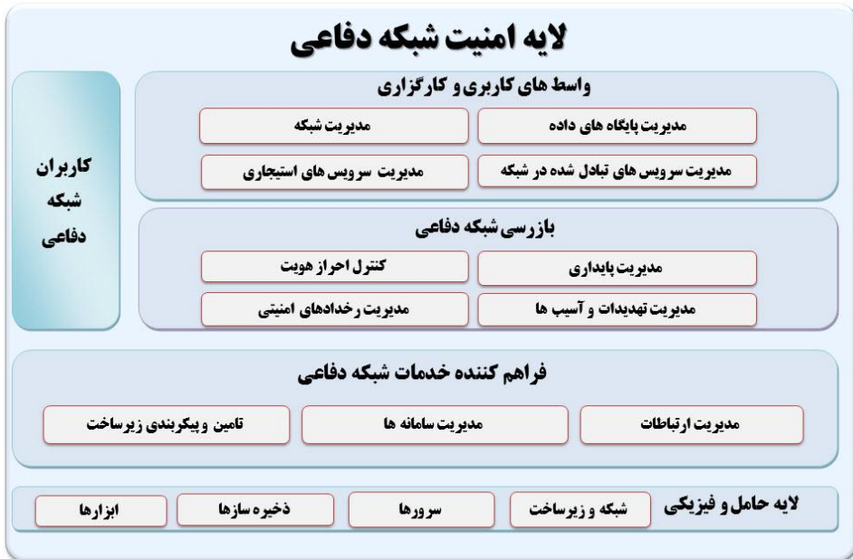
شکل ۳. الگوی امنیت برای معماری شبکه حوزه دفاعی

در معماری شبکه حوزه دفاع باید سرویسی تحت عنوان امنیت به مجموعه اضافه شود تا اشراف امنیتی بر روی سایر سرویس ها و خدمات به وجود آورد. همچنین تأمین یکپارچگی، محرمانگی و دسترس پذیری به سرویس ها علی الخصوص در شرایط بحرانی در این بخش انجام می گیرد. نظارت بر امنیت خدمات برون سپاری شده دفاعی که حائز اهمیت می باشد نیز بر عهده این بخش است و سرویس هایی به عوامل خارج از سازمان دفاعی سپرده می شوند که از امنیت آن ها اطمینان حاصل شده باشد. تأمین و پیکربندی زیرساخت های مورداستفاده در معماری رایانش ابری دفاعی که غالباً در لایه حامل و فیزیکی وجود دارند نیز در این قسمت تعبیه شده است. نحوه پیکربندی زیرساخت شبکه ای که در شبکه دفاعی مورداستفاده قرار می گیرد دارای طبقه بندی های لازم می باشد و لازم است که امنیت پیکربندی تأمین گردد. همچنین مدیریت پیکربندی کارگزاری شبکه ارتباطی دفاعی که بستر اصلی برای زیرساخت ارتباطی کلیه شبکه های نیروهای مسلح می باشد نیز در این قسمت انجام می شود. لازم به ذکر است وجود این شبکه امن باعث شده تا دغدغه های ارتباطات بین کلیه بخش های شرکت کننده در محیط رایانش ابری از بین برود و لازم نباشد در این تحقیق به آن پرداخته شود.