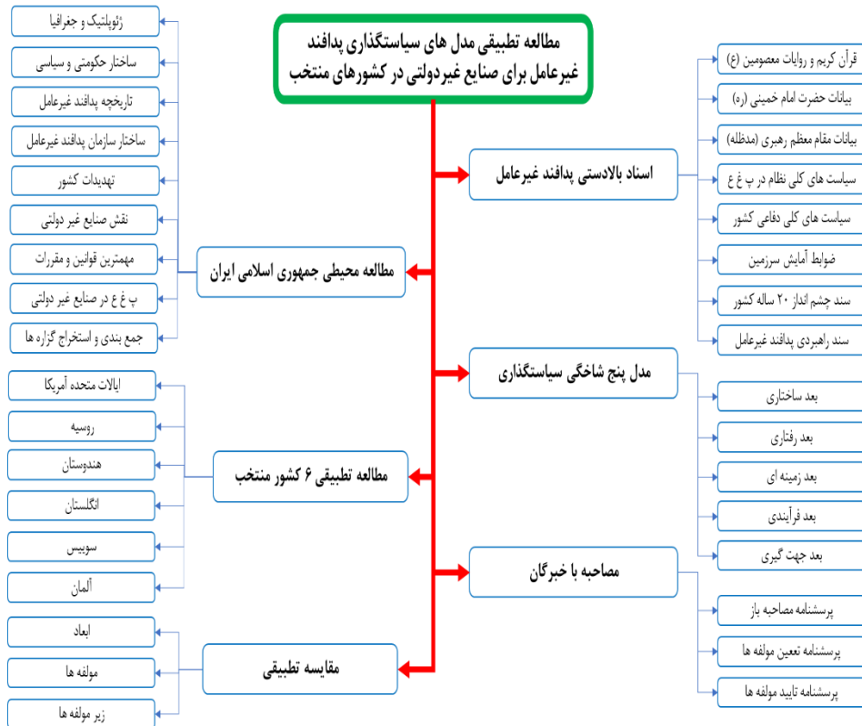
شکل ۱- چارچوب نظری پژوهش

چارچوب نظری، یک مدل مفهومی است مبتنی بر روابط تئوریک میان شماری از عواملی که در مسئله پژوهش با اهمیت تشخیص داده شده‌اند. در اینجا، آمیختن باورهای منطقی پژوهشگران با پژوهش‌های انتشار یافته به منظور ایجاد پایه علمی برای بررسی مسئله مورد پژوهش جایگاه اساسی دارد. (طیبی، ۱۳۹۲، ۷۸) بنابر این به منظور ارائه تصویر ساده از مفهوم کلی تحقیق، چارچوب نظری برای مطالعه تطبیقی مدل‌های سیاست‌گذاری پدافند غیرعامل در صنایع غیر دولتی برای کشورهای منتخب با استفاده از اسناد بالادستی، بیانات حضرت امام (ره) و مقام معظم رهبری (مدظله) و مفاهیم، تئوری‌ها، نظریه‌های علمی، مدل‌های سیاست‌گذاری، مطالعه محیطی ج.ا.ایران، مطالعه تطبیقی ۷ کشور منتخب و مصاحبه با خبرگان ارائه می‌گردد.