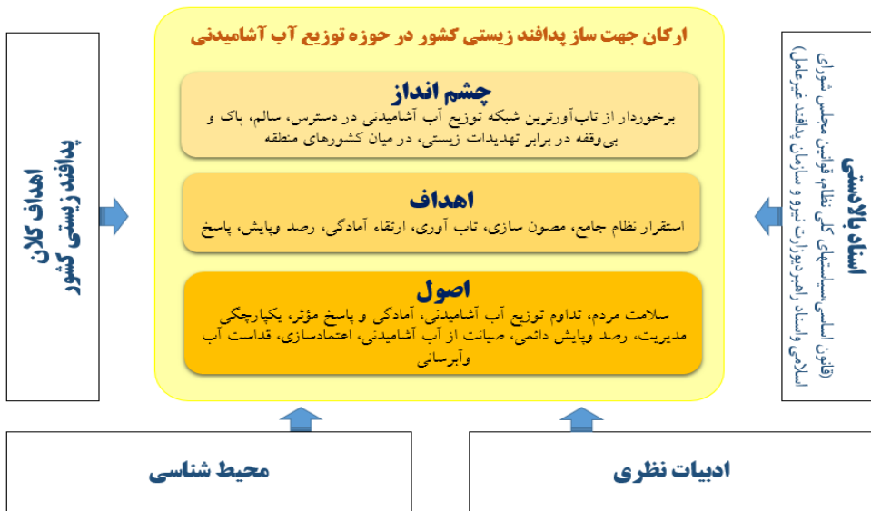
شکل ۴: مدل مفهومی ارکان جهت ساز پدافند زیستی حوزه آب آشامیدنی (محقق ساخته)

اعتمادسازی و اطمینان بخشی سلامت آب آشامیدنی؛ رصد و پایش دائمی تهدیدات زیستی آب آشامیدنی؛ در پاسخ به سؤال دوم که «چشم انداز پدافند زیستی حوزه توزیع آب آشامیدنی کدام است؟» چشم انداز ۱۴۱۰ پدافند زیستی حوزه توزیع آب آشامیدنی این گونه تعیین شد: «دارای تاب آوری شبکه توزیع آب آشامیدنی سالم و بی وقفه در برابر تهدیدات زیستی در میان کشورهای منطقه» که برای این چشم انداز ۶ مشخصه تعریف گردید و در نهایت در پاسخ به سؤال سوم که «اهداف کلان پدافند زیستی حوزه توزیع آب آشامیدنی کدام اند؟» اهداف کلان مطابق جدول ۱۶ در ۶ بند تدوین و مطابق جدول ۱۸ اولویت بندی گردید و بر این اساس ارکان جهت ساز پدافند زیستی حوزه توزیع آب آشامیدنی واکاوی و تبیین شد. در شکل شماره رابطه متغییرها در قالب مدل مفهومی ترسیم شده است.