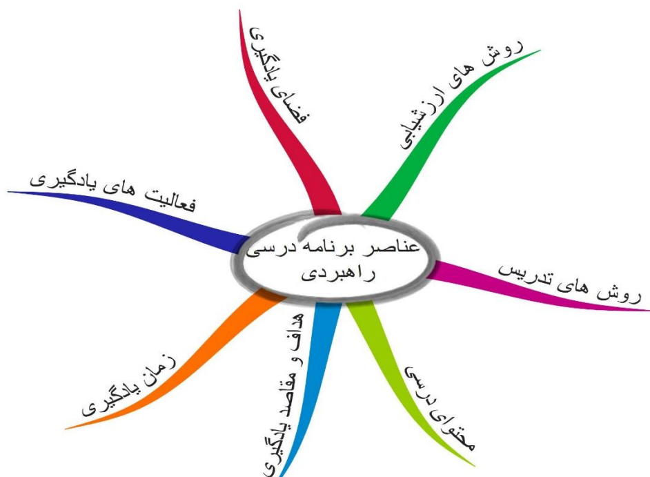
شکل ۱. عناصر برنامه درسی دروس راهبردی بر اساس مبانی نظری