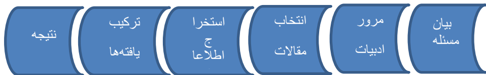
شکل ۲: مراحل پیاده‌سازی روش فراترکیب

برای انجام پژوهش حاضر از روش فراترکیب ۱ و برای تجزیه و تحلیل داده‌ها از روش تحلیل تم استفاده شده است. روش فراترکیب نوعی روش تحقیق است که برای ترجمه‌های تفسیری و یا ایجاد تئوری با بهره‌گیری از یکپارچگی و مقایسه یافته‌های مختلف استفاده می‌شود. هدف فراترکیب ایجاد تفسیری خلاقانه و یکپارچه از یافته‌های کیفی است (حجازی‌فر و همکاران: ۱۳۹۶). در واقع فراترکیب با فراهم کردن یک نگرش نظام‌مند برای پژوهشگران از طریق ترکیب پژوهش‌های کیفی مختلف، به کشف موضوع‌ها و استعاره‌های جدید و اساسی می‌پردازد و با این روش، دانش فعلی را گسترش داده و یک دید جامع را نسبت به مسائل به وجود می‌آورد. برای دستیابی به هدف پژوهش از روش فراترکیب، مطابق با الگوی ساندلوسکی و باروس ۲ (۲۰۰۷) استفاده شده است. این الگو شامل هفت مرحله است که خلاصه این مراحل در شکل ۲ مشخص است.