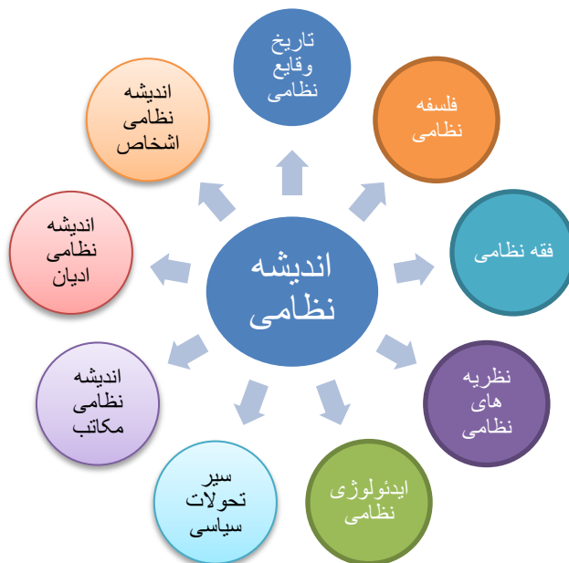
شکل ۳: مدل مفهومی تحقیق

تعیین ضرایب مسیر هریک از ابعاد احصاء شده دانش اندیشه نظامی نشان‌دهنده این است که ضرایب مسیر همه ابعاد بالاتر از ۰.۴ بوده لذا از دید پاسخ‌دهندگان ابعاد ۹ گانه تأییدشده‌اند و بر همین اساس ابعاد کلان دانش اندیشه نظامی در قالب شکل ۳ احصاء شده است: