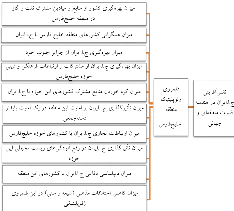
شکل ۲: چارچوب مفهومی تحقیق

از آنجایی که محققین در این تحقیق به دنبال کشف مؤلفه و شاخص‌های نقش آفرینی ج.ا.ایران در هندسه قدرت منطقه‌ای و جهانی با توجه به قلمرو ژئوپلیتیک خلیج فارس می‌باشند؛ لذا پس از بررسی ادبیات نظری، اسناد و مدارک متناسب با چارچوب نظری تحقیق محیط‌شناسی را انجام داده و زمانی که با کمبود ادبیات و اسناد و مدارک مواجه شد با مصاحبه با افراد متخصص علم ژئوپلیتیک و علوم دفاعی این نقیصه را برطرف تا سرانجام شاخص‌های تحقیق به شرح ذیل احصاء گردید.