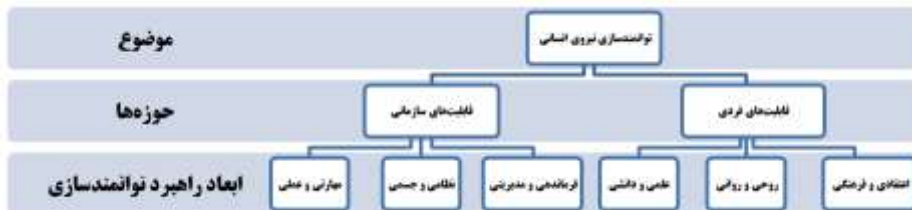
شکل ۱: ابعاد راهبرد توانمندسازی نیروی انسانی (محقق ساخته)

چارچوب نظری: در تحقیقاتی که از نوع نظریه‌پردازی و به روش داده بنیاد صورت می‌پذیرد، طرح چارچوب نظری، فاقد موضوعیت می‌باشد. با این وجود، پژوهشگران با نگرش دقیق به دیدگاه‌های توانمندسازی نیروی انسانی و انسان از دیدگاه اسلام، حوزه‌های تدابیر و اوامر فرماندهی معظم کل قوا (مدظله‌العالی) و استفاده از مطالعات تطبیقی و نظری و علمی انجام شده، ساختار راهبرد توانمندسازی نیروی انسانی را تابع طبقه‌بندی به شرح زیر می‌دانند.