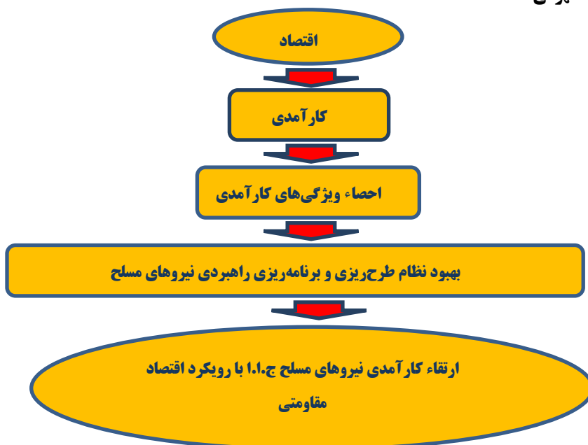
شکل ۱: چارچوب مفهومی پژوهش